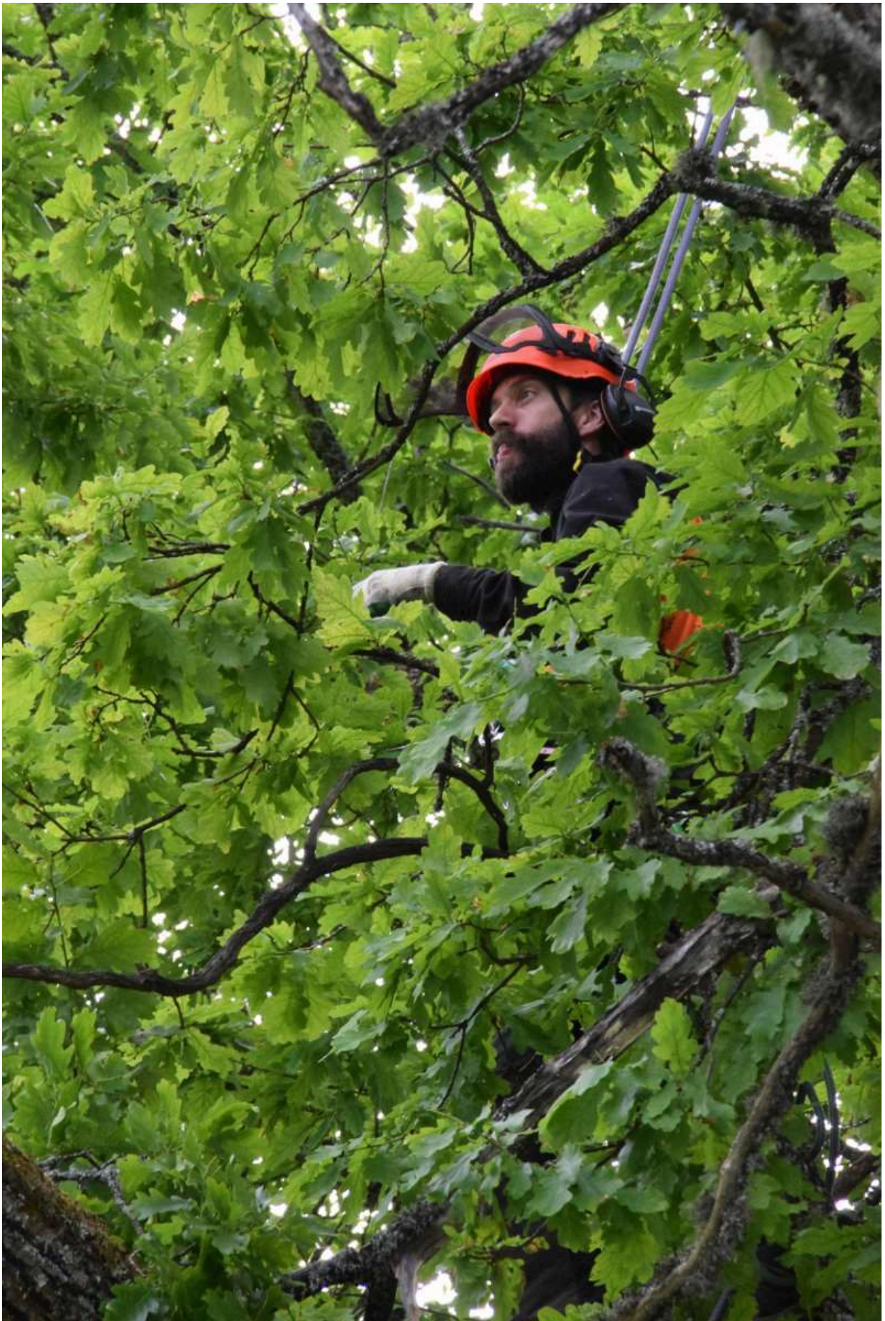
Flere hundre år gammelt eiketree ble beskåret Knut Thorvaldsen tok initiativ