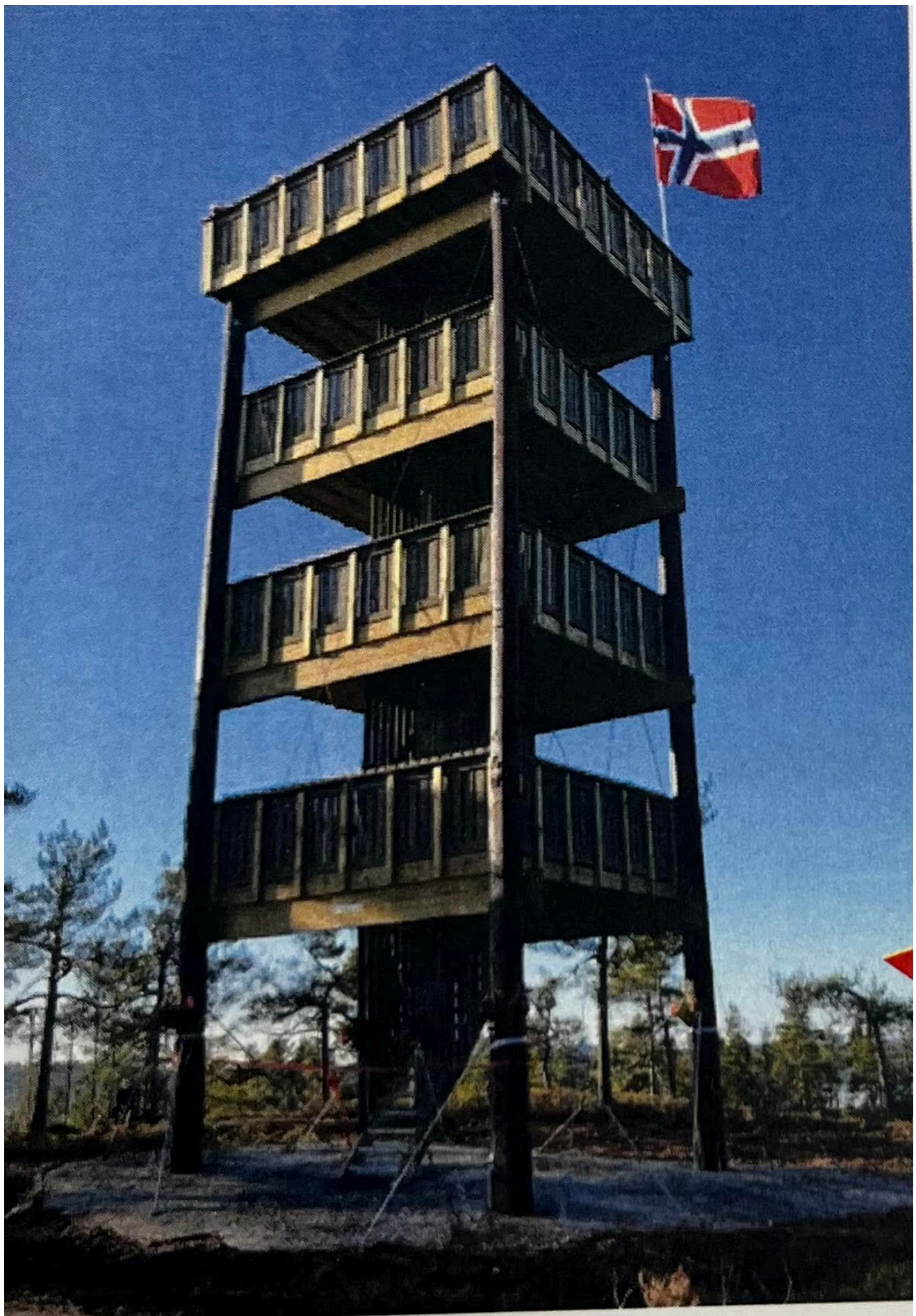
UTSIKT: Fra utsiktstårnet på Mjærskaukollen kan man se vidt og bredt.