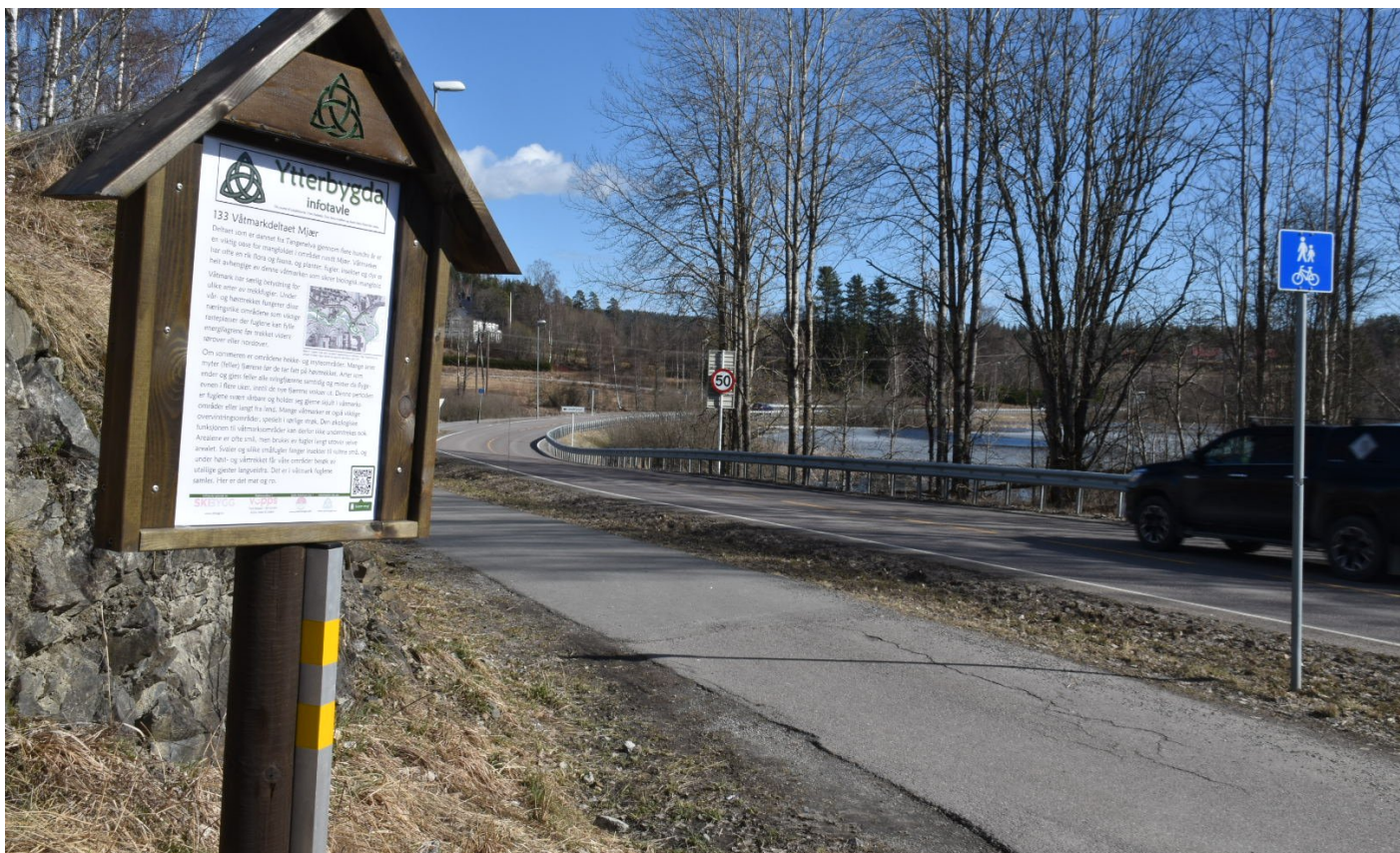
Tavle med informasjon om våtmarksområdet står nå ved Kiwi.

Sist, men ikke minst, tar Bergtatt frem telefonen og registrerer tavlen som PokéStop.