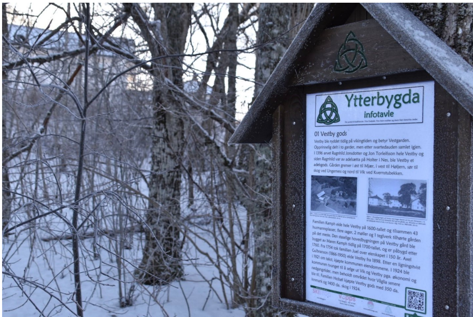
Vestby gods ligger ved Østmarka Golfklubb.