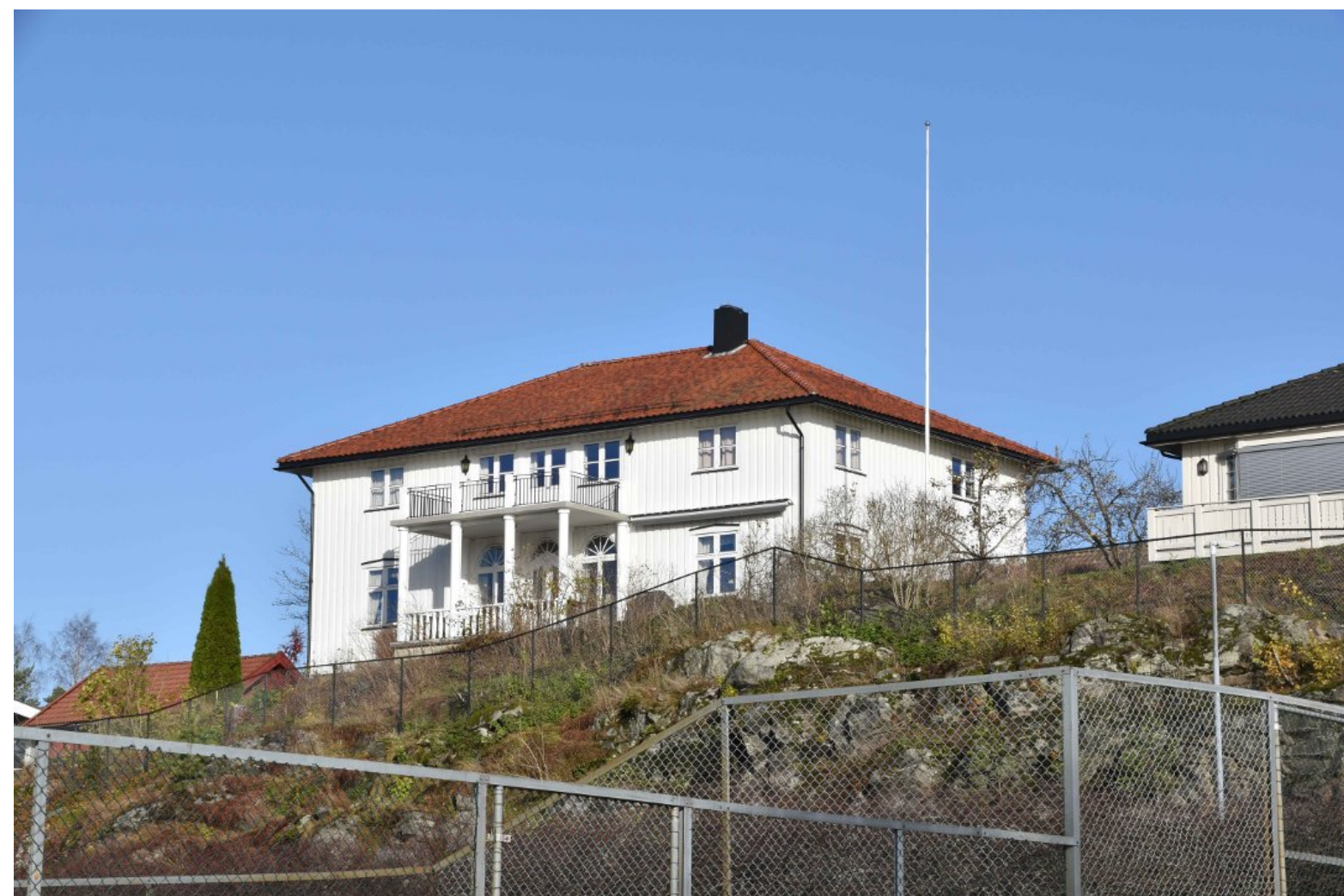
Huset er godt gjenkjennelig i Haresvingen i Våglia.