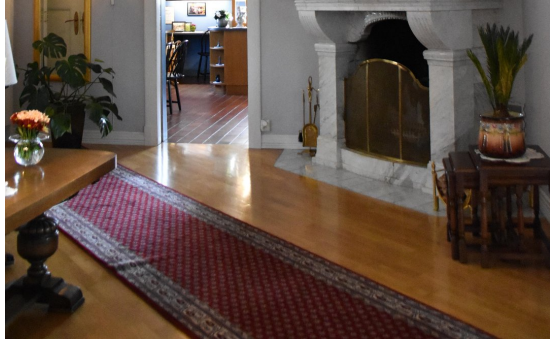
Peisen i Carrera marmor og trolig fra mellom 1915 og 1917.

I taket henger en av de antikke lampene fra bygningen; 70 tunge kilo og fra USA. Med på «lasset» fulgte også dører og vinduer.