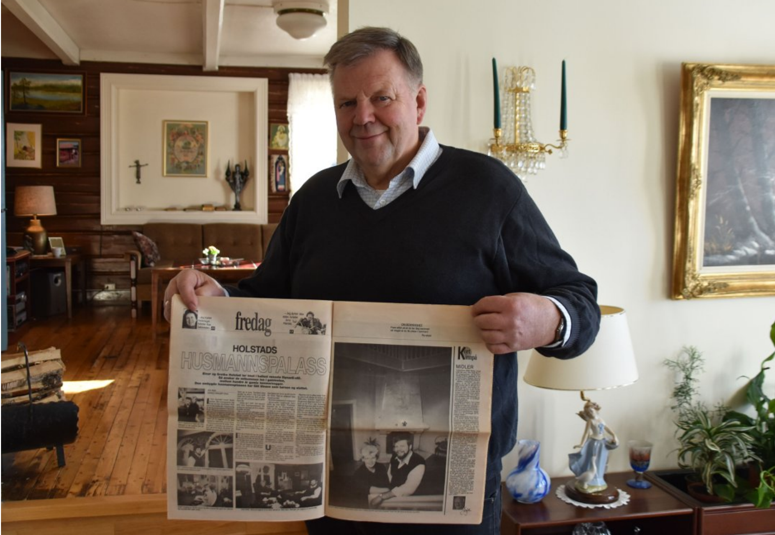
Tidligere laget Østlandets Blad artikkel om det spesielle huset i Ytre.