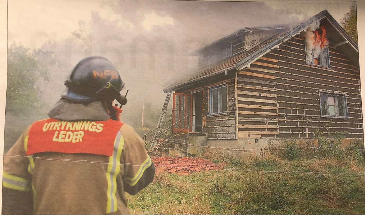
KONTROLLERT NEDBRENNING: Åtte brannmenn fra Nordre Follo brannvesen øvde seg på slukking i Ytre i går.