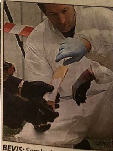
BEVIS: Samles inn.