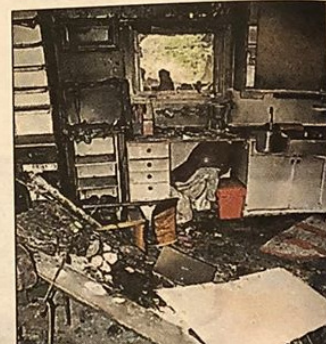
KREVENDE: Finn brannårsaken.

GRO ARNEBERG THORESEN gro.arneberg.thoresen@enebakkavis.no