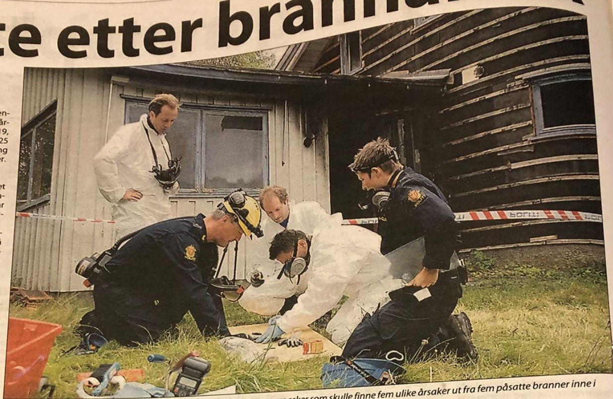
OPPLÆRING I ETTERFORSKNING: Det krydte av folk i hvite dresser og masker som skulle finne fem ulike årsaker ut fra fem påsatte branner inne i våningshuset i Sagstuveien 19 tirsdag.

– Skal brannene illustrere alt fra påsatte branner til feil ved el-