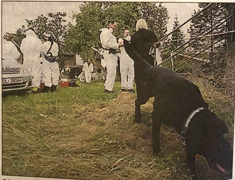
BRANNHUND: Også en snusende og leken brannhund var på plass i Sagstuveien 19 tirsdag.