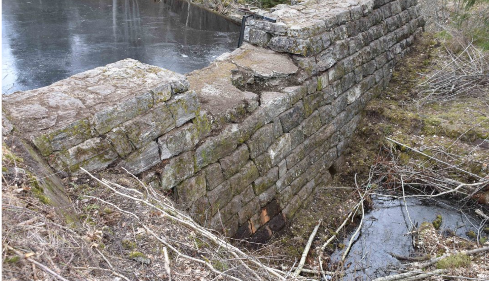
Demningen i dag.