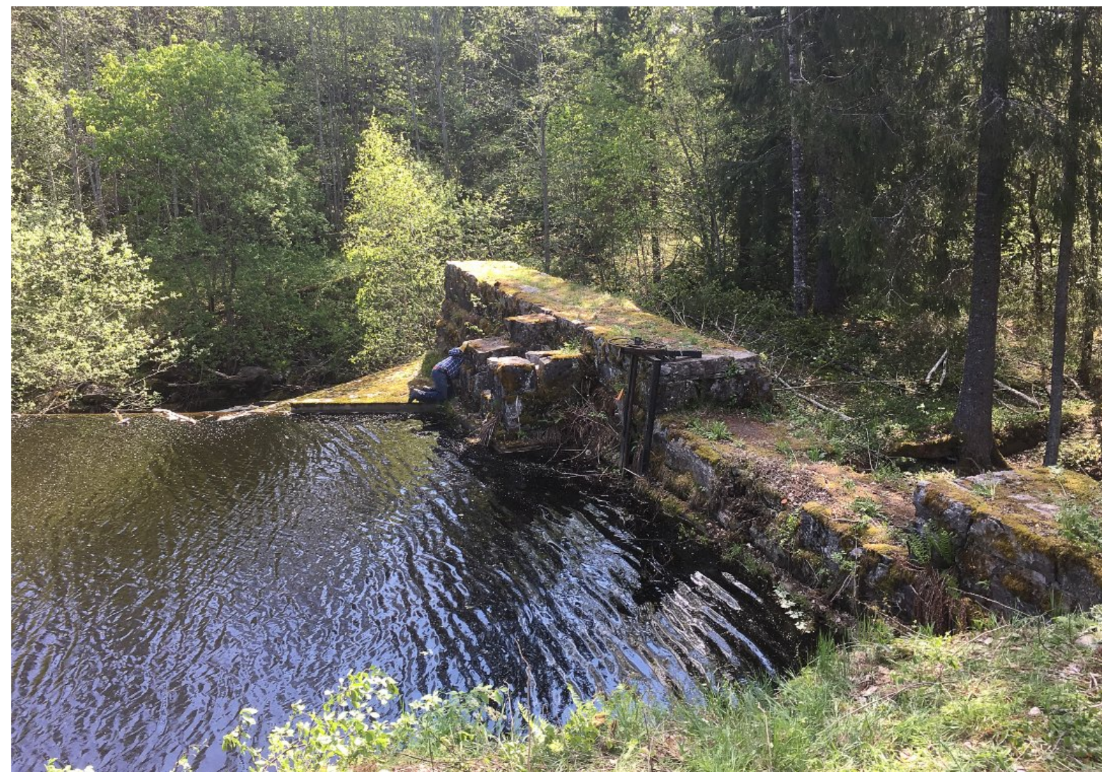
Slik så demningen ut før arbeidene med mosefjeringen startet.

Bråtendammen lå da nærmest som en tynn bekk og demningen var nesten usynlig etter at vill vegetasjon i form av kratt og trær hadde fått vokse fritt i altfor mange år, forteller de.