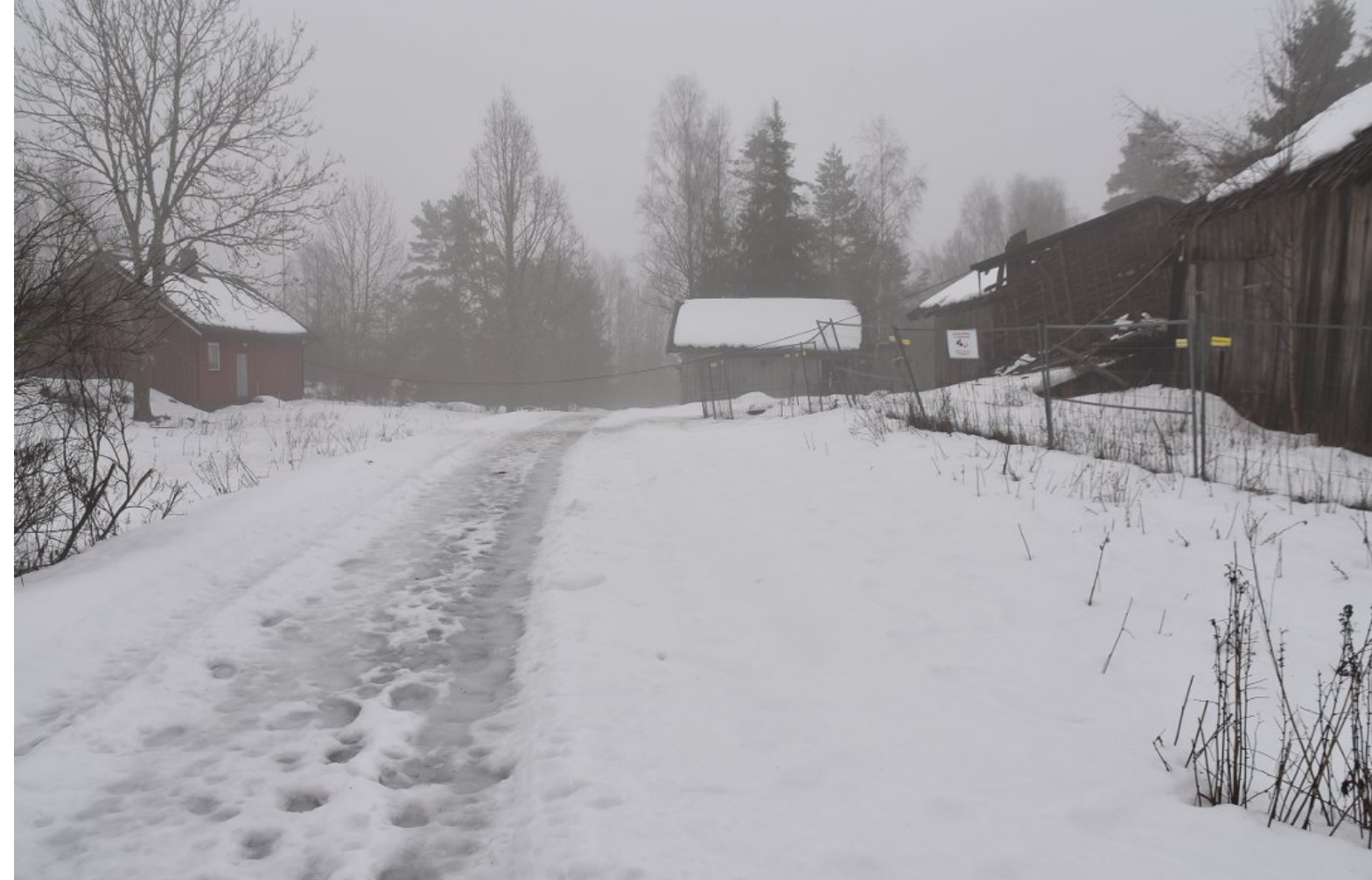
En ledning, uten strøm, hang i noen dager over veien gjennom Kvernstua.