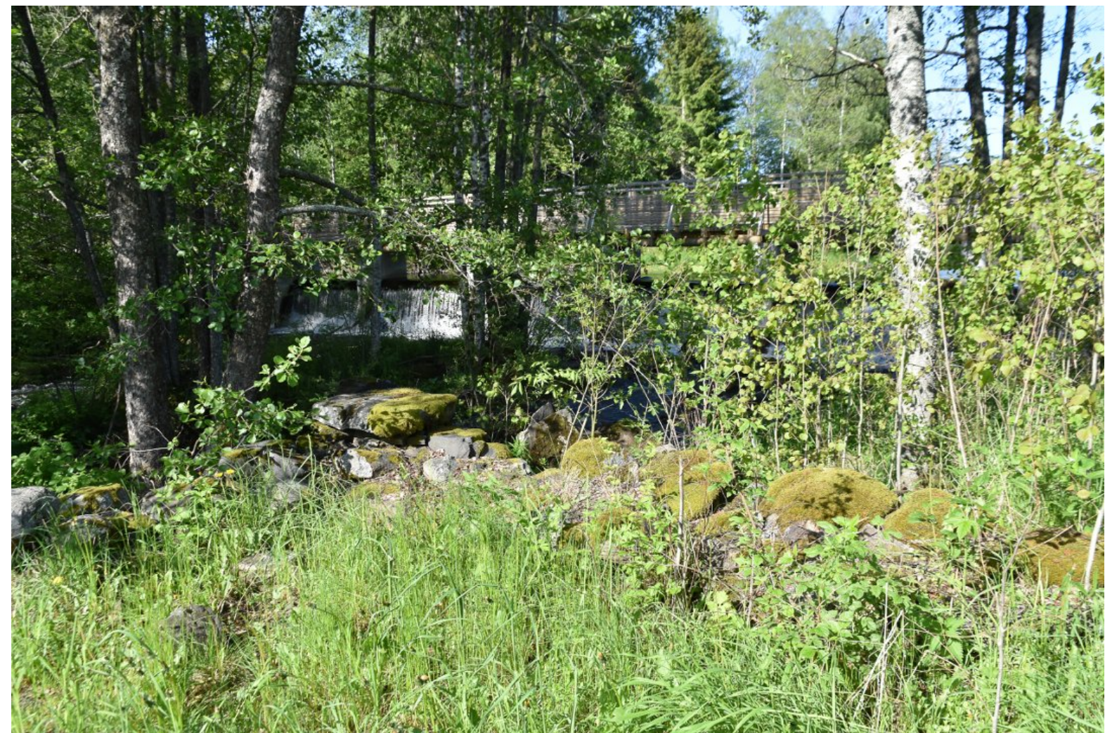
Et villniss som samler søppel? Dette er tuftene etter hjulmakerverkstedet - noe av det planene mener man kan gjenreise.